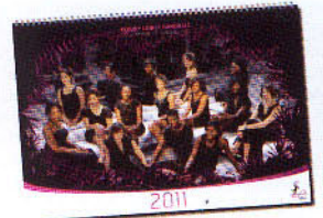
2011年カレンダーの表紙

ビジュアル関連の統一感徹底的。カレンダーではドレスを着用し、ポーズを決める。最近、海外ではセミヌード写真で手取り早いインパクトを求めている女子チームが多いが、レス・パンサレスは安易なセクシー路線を拒否。「品のある女性らしさ+カッコ良い」を追求している。