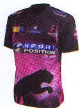
2009-10初代ユニフォーム 黒バージョン

まず目を引くのがユニフォーム。チームカラーのピンクと黒をベースに、日本人にはなかなか着こなせない「お腹に動物」を大胆に配置。さらに背中側は両肩で眼が光っているという斬新すぎるデザインだ。創設2年目となる2010-11シーズンは、より一層パワーアップ。正面全体に豹の顔が描かれ、お腹部分に大きな口と牙が見えるという、前衛的なデザインとなっている。